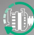
ALTERNATOR TEST SMART ALTERNATOR COMPATIBLE